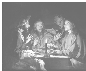
Matthias STOM, Večera u Emausu , 1632., Thyssen-Bornemisza muzej, Madrid, Španjolska