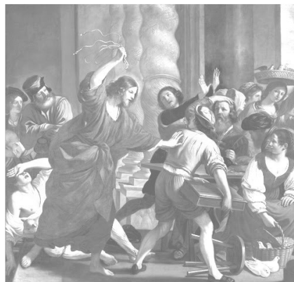
Giovan Francesco BARBIERI, Krist protjeruje trgovce iz Hrama , 16. st., Muzej u Genovi, Italija