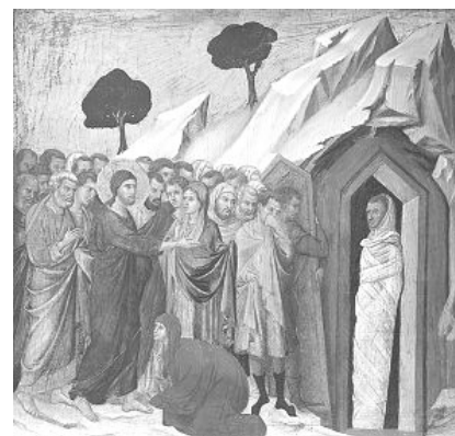
Duccio di BUONINSEGNA, Uskrišenje Lazara , oko 1310., Muzej umjetnosti Kimbell, SAD