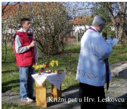
Križni put u Hrv. Leskovcu

Veliko ili Sveto trodnevje bilo je upriličeno s ugodnim naglaskom i zavidnom aktivnošću svih župljana. Na svim obredima i na sam Uskrs na svim misama, vjernika je sudjelovalo više