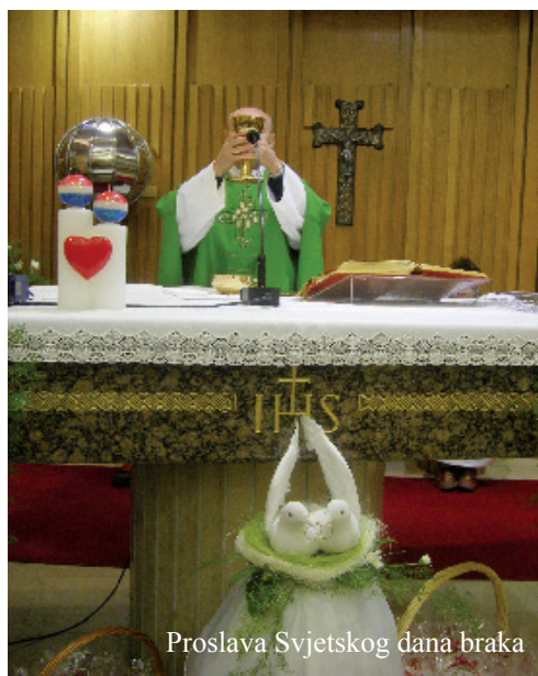
Proslava Svjetskog dana braka