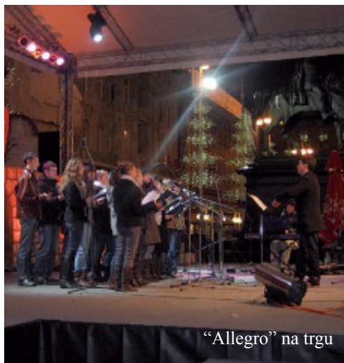
„Allegro“ na trgu

Dana 15. prosinca 2008. godine zbor je na veliku radost održao jednosatni božićni koncert na Trgu bana Josipa Jelačića u sklopu manifestacije „Advent u srcu Zagreba“.