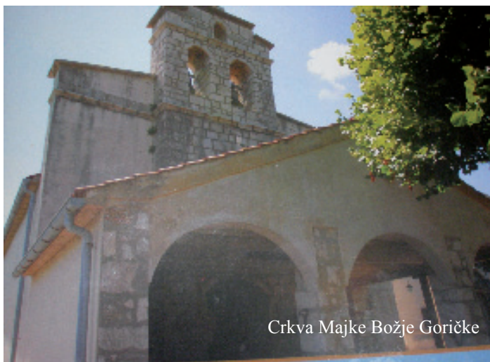
Crkva Majke Božje Goričke

Svetište se ubraja među najstarija marijanska svetišta u Hrvatskoj. Njegovo prvo spominjanje datira u 11. stoljeće kada je bilo smješteno u području Goričice u Jurandvoru. Na području gdje se sada nalazi je od 15. stoljeća, a posvećeno je 1550. godine. Predaja govori da su djeca na tom brijegu pronašla Marijin kip iz crkve u Jurandvoru. Nekoliko je puta kip