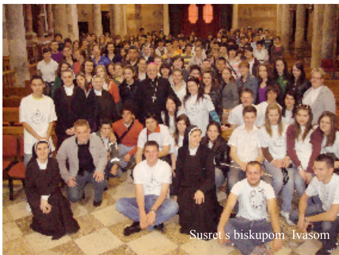
Susret s biskupom Ivasom

mladeži iz Hrvatske i BiH, završen je u subotu 18. travnja razgledavanjem znamenitosti Zadra, a prethodno misnim slavljem koje je u katedrali Sv. Stošije predvodio zadarski nadbiskup Ivan Prenda. Izrazio je radost zbog susreta 200 mladih predvođenih karmeličankama Božanskog Srca Isusova te je istaknuo važnost toga da mladi imaju duboku vjeru ukorijenjenu u Krista kako bi je mogli svjedočiti. “Ta vjera treba rasti, treba je čuvati i obogaćivati kako bismo mogli biti uvjerljivi svjedoci drugima”, poručio je mons. Prenda mladima koje je nakon sv. Mise upoznao i s poviješću zadarske katedrale. Karmelijada je s duhovno rekreativnim programom započela 16. travnja u Bibinju gdje u samostanskoj kući djeluju četiri karmeličanke Božanskog Srca Isusova čija je središnjica Hrvatske provincije, u kojoj je 120 redovnica, prije šest godina i započela s održavanjem tih susreta. Na njima se okuplja mladež