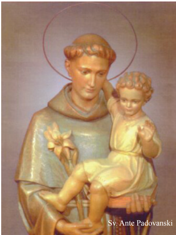
Sv. Ante Padovanski

Tada se dogodilo nešto što je okrenulo smjer njegova života. Don Pedro, infant portugalski, donese u Koimbru ostatke petorice misionara iz reda sv. Franje, sv. Bernarda i njegovih drugova, koji su početkom godine 1220. u Maroku poginuli mučeničkom smrću. Ugledavši ove svete ostatke usplamti željom, da postane redovnikom sv. Franje te da i on prolije svoju krv i podnese mučeničku smrt za svetu vjeru. Uzalud su ga njegova braća odvrćala od tog nauma. Već u ljetu 1220. godine stupi u samostan Manje braće u Olivares kod Koimbre. Iz poštovanja prema sv. Anti pustinjaku, kojemu je tamošnja kapelica bila posvećena, uzeo je on redovnik franjevac, ime Ante. U poniznosti i jednostavnosti