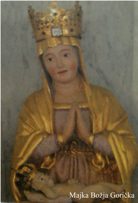
Majka Božja Gorička

pronađen na istome mjestu te je odlučeno da se tu sagradi crkva. Po zagovoru Majke Božje događala su se mnoga čuda pa je normalno da je svetište postalo hodočasničko mjesto. Pored svetišta se od davnina nalazila kuća Bratovštine sv. Marije čiji su članovi brinuli za crkvu i hodočasnike.