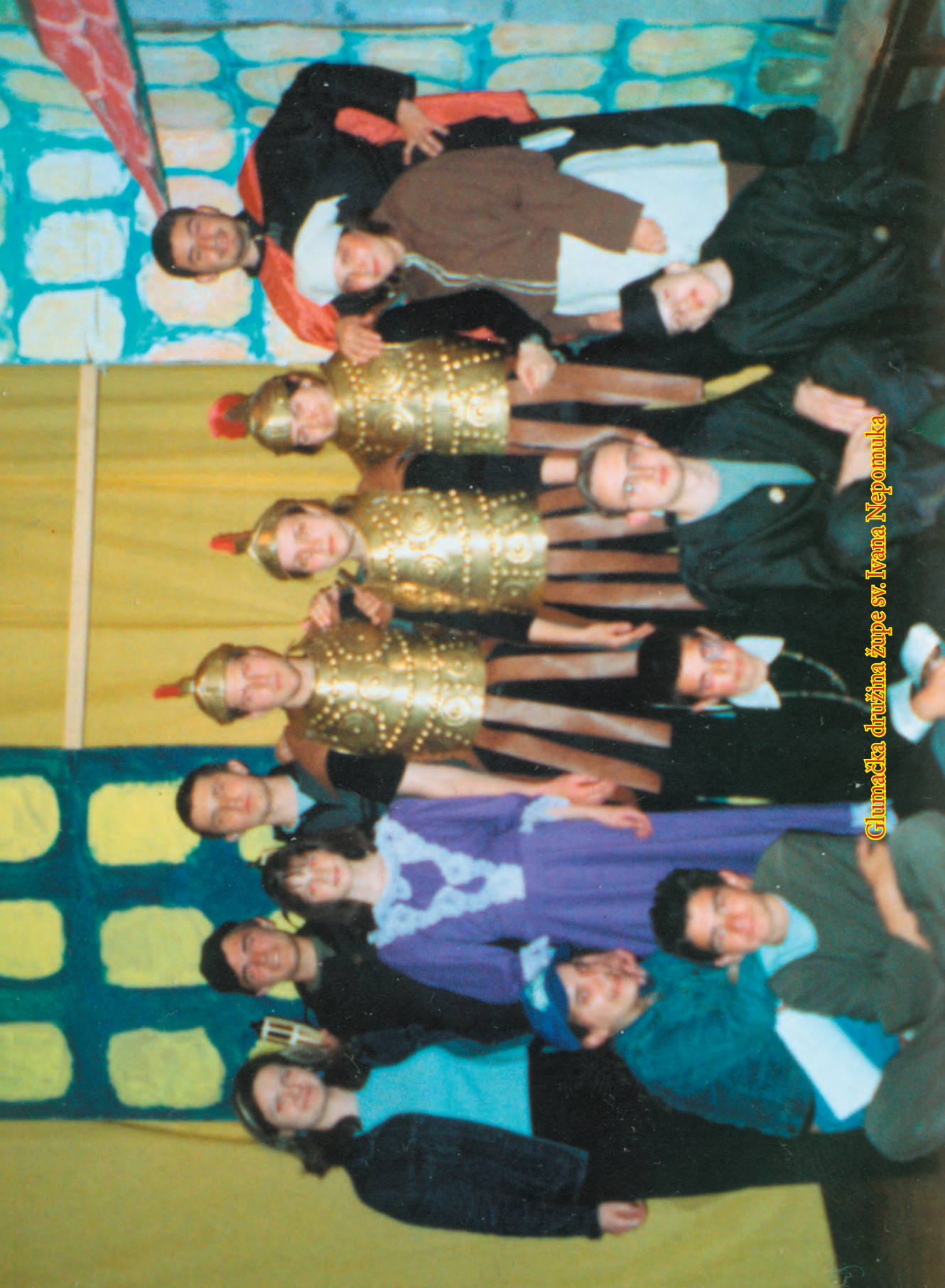
Glumačka družina župe sv. Ivana Nepomuka