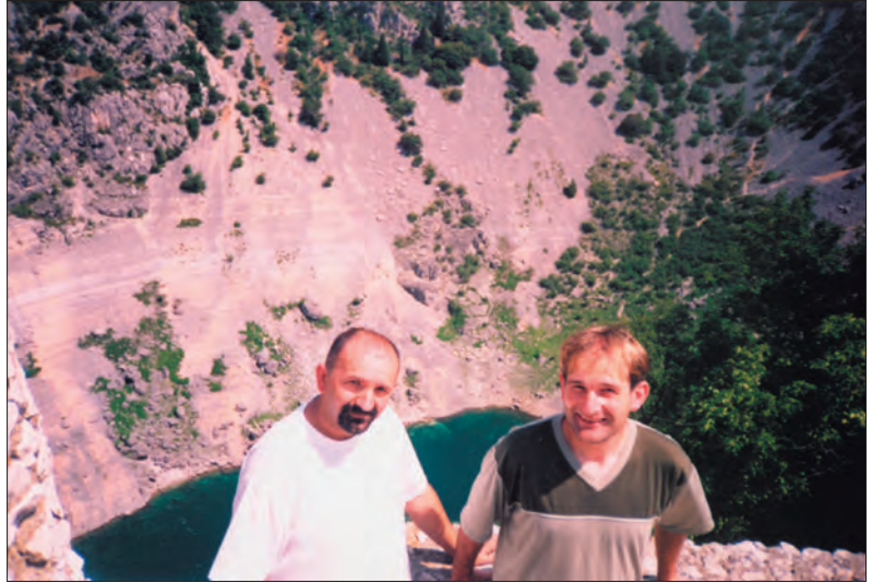
Urednici pored Modrog jezera u Imotskom

Naša prva stanica je bila na izvoru u Viti ni kod Ljubuškog. Divili smo se čistoći vode