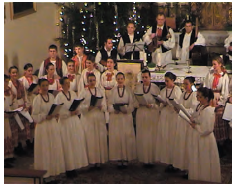
Božićni nastup KUD-a "Kraluš" u župnoj crkvi

KUD "KRALUŠ" je odlične rezultate polučio i na međunarodnim smotrama folkloru u Italiji, Poljskoj i Mađarskoj, gdje je