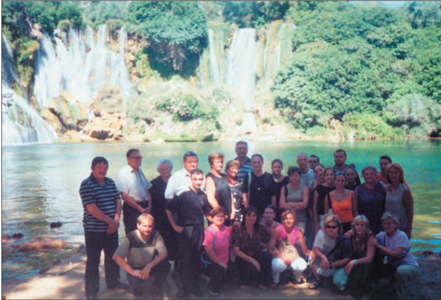
Članovi KUD-a "Oráč" na slapovima Kravice

Na poziv župnika i upravitelja svetišta Presvetog Srca Isusova iz Studenaca kod Ljubuškog, članovi našeg KUD-a "Oráč" iz Demerja proveli su nekoliko prekrasnih dana u Hercegovini. Povod tom gostovanju je bio Dan župnog zajedništva koji se tradicionalno u toj župi slavi u subotu prije Velike Gospe. Tom prigodom okupljaju se svi župljani koji tamo žive kao i oni koji su odselili. Putovanje iz Zagreba je bilo ugodno i bez teškoća.