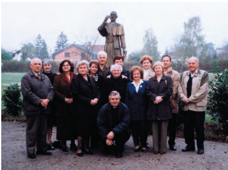
Odbor Župnog caritasa pred kipom bl. A. Stepinca