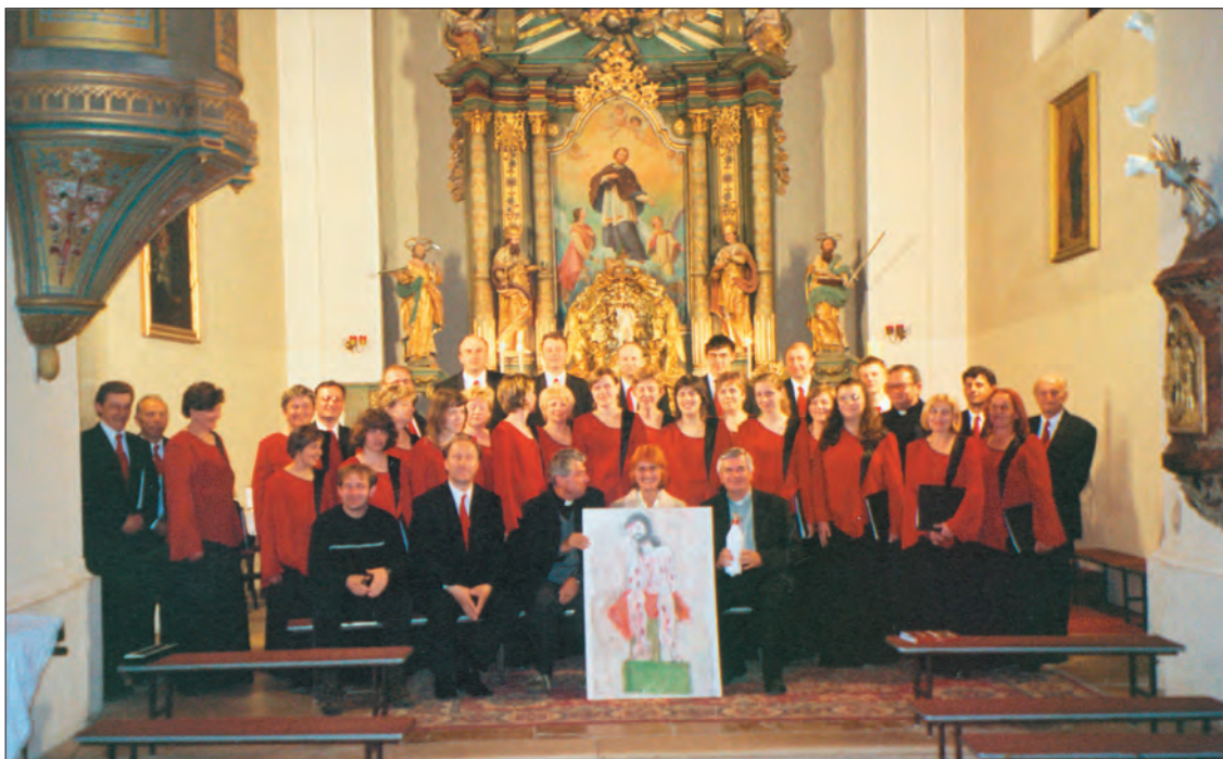
Župni zbor iz Tuhlja nas je oduševio svojim pjevanjem