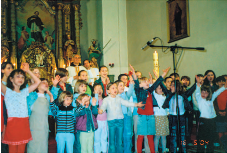
“Krijesnice” uvijek donose radost u našu zajednicu