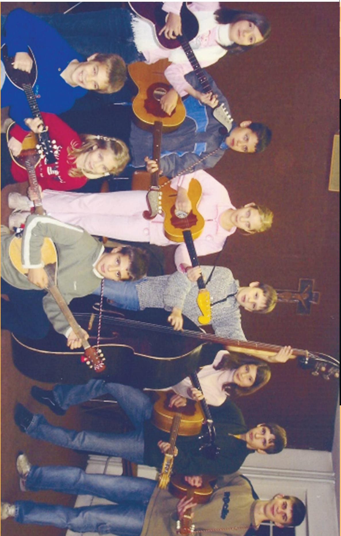
MLADI TAMBURAŠI HKZ "MI" tamburica